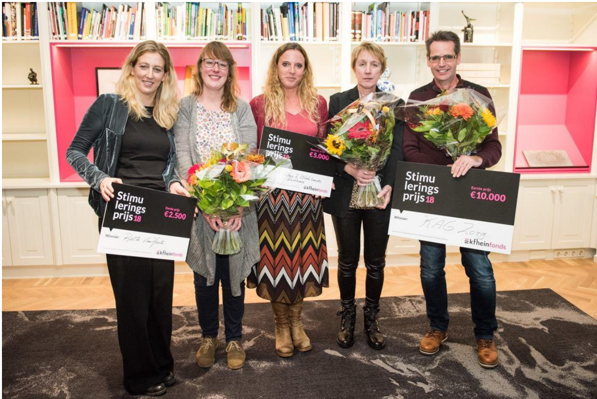
De prijswinnaars van de Stimuleringsprijs 2018